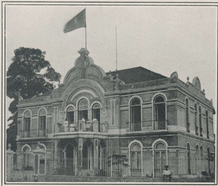
Filiale de la Banque à Bolama (Province de Guinée).

Iles du Cap-Vert { S. Vincent S. Thiago. Province de Guinée { Bissau. Bolama Golfe de Guinée { S. Thomé. Principe. Province d'Angola : Loanda, Malange, Lobito, Benguela, Novo Redondo, Mossamédès. Province de Mozambique : Lourenço-Marques, Inham- bane, Beira, Chinde, Tete, Quelimane, Mozambique. Inde Portugaise { Nova Gôa. Mormugão. Chine : Macau. Océanie : Dilly, Timôr.