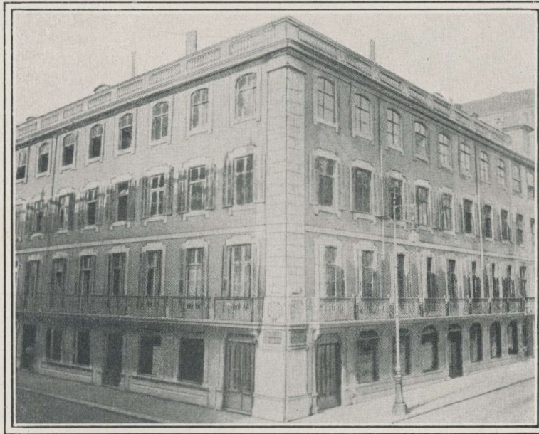
Siège social de la Banque à Lisbonne.

Représentée dans toutes les villes du PORTUGAL et Iles adjacentes