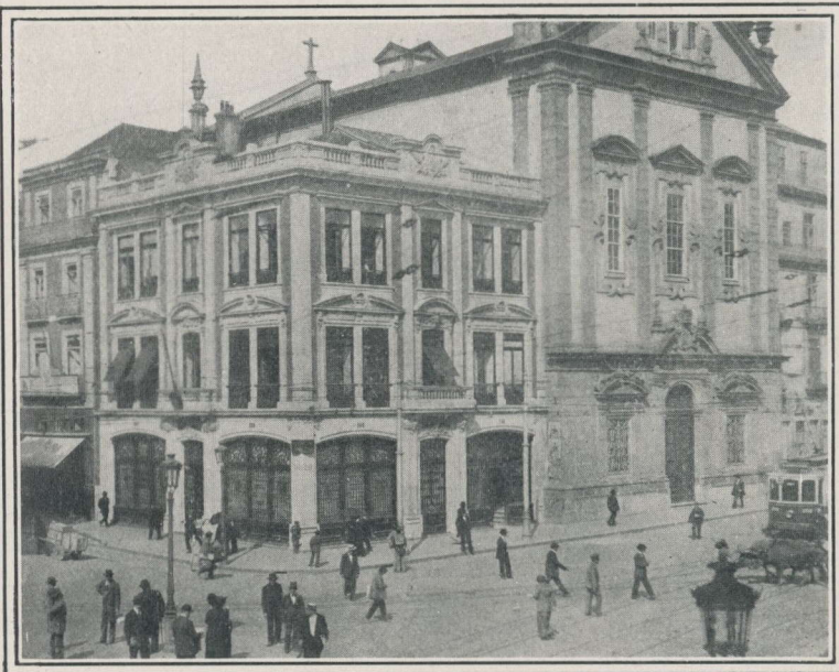
Filiale de la Banque à Porto.